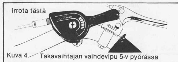
Kuva 4 Takavaihtajan vaihdevipu 5-v pyörässä