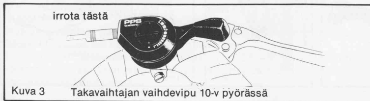
Kuva 3 Takavaihtajan vaihdevipu 10-v pyörässä